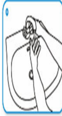
Ellerinizi su ile yıkayın.