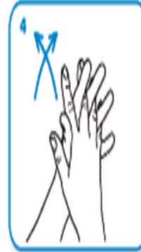
Parmaklarınızın arasını parmaklarınızı birbirine geçirerek ovun.