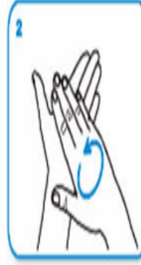
Avuç içlerini ovun.