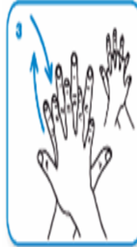
Sağ el ile sol elin sırtını ve parmakların arasını ovun, diğer el için de aynı hareketleri tekrarlayın.