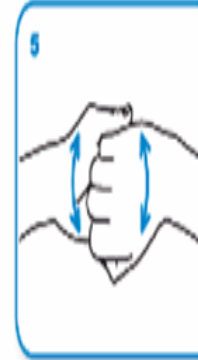
Parmaklarınızın sırtı el ayalarınıza gelecek şekilde parmaklarınızı kenetleyin.